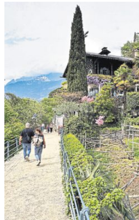
Der schönste Wanderweg von Meran: Auf dem Tappeinerweg, hoch über der Stadt am unteren Ende des Vinschgaus, warten eine vielfältige Botanik, spannende Kunstinstallationen und lauschige Außengastronomie für jeden Geschmack.