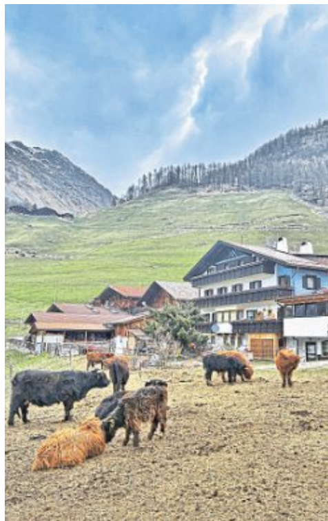
Im Vinschgau auf der Höhe von Naturns geht's seitwärts: Wenn die Wintersportler weg sind, kehrt im Schnalstal Ruhe ein. Dann lässt es sich hier oben prima wandern und die Natur genießen. Und frische Luft ist immer inklusive.