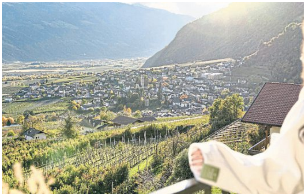
Wellness mit Ausblick: Vom Niedermair Nature Retreat lässt sich der Vinschgau kilometerweit überblicken – das Tal hoch nach Partschins, das Tal hinunter bis nach Meran.

Also begnügen wir uns in Innsbruck nicht nur mit dem Pflichtprogramm in der Altstadt unterm Goldenen Dachl. Wir schnallen die Fahrräder vom Heck unseres Wagens ab und radeln ein Stück am Inn hinunter bis nach Hall. Das kleine österreichische Städtchen mit seiner ungezwungenen Ursprünglichkeit lädt bei strahlendem Sonnenschein auf dem Platz an der Kirche zu einem Kaffee ein. Und schon nach dem ersten Schluck weht dieser sanfte Urlaubswind um die Ecke. Fast wie gebucht. Aber noch nicht am Ziel. Weiter geht's mit dem Auto über die A 12 und