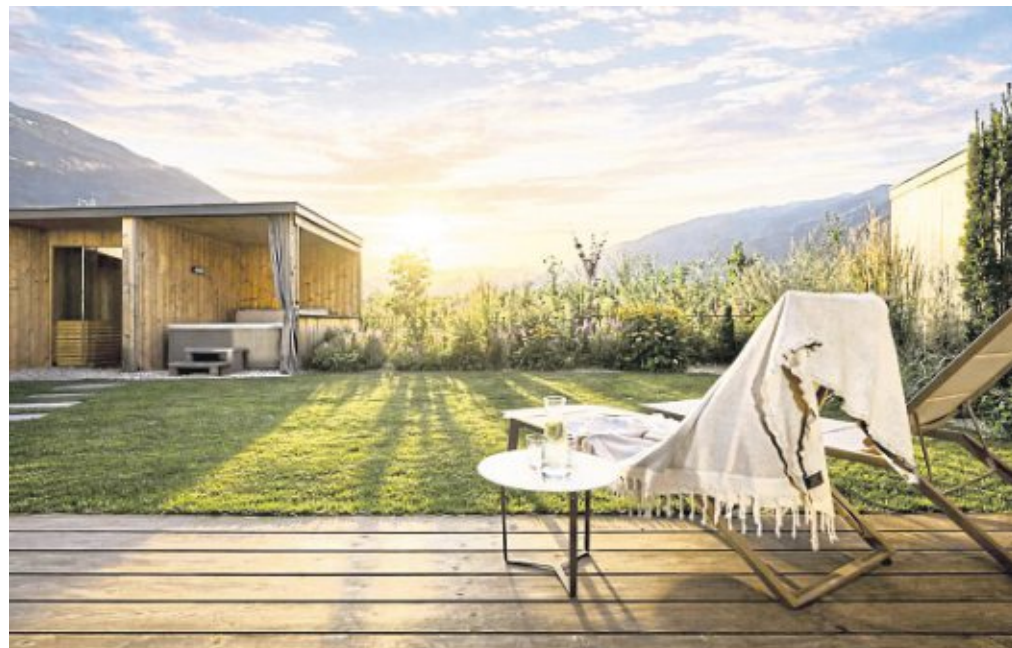
Auch so sieht Wellness im Vinschgau aus: In den privaten Lodges im Amolaris lässt sich nach Sauna und Whirlpool der Sonnenuntergang im eigenen Garten genießen.