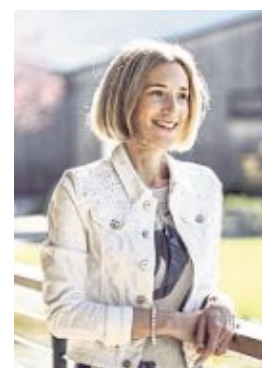
„Bei uns kann niemand mit dem Wort 'Overtourism' etwas anfangen.“

Genuss bereits die ersten Haken dran sind, folgt am nächsten Tag die Bewegung. Die Radtour geht ins Martelltal, das Teil des Natio-