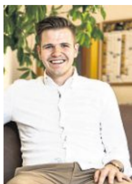
„Dass die Natur eine Hauptrolle spielt, stand außer Frage.“

panorama und dem vielstimmigen Gesang der Vögel aus dem benachbarten Apfelpfad. Das hat ja schon mal gut geklappt. Und gut